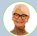
Ann Kathrin Linsenhoff

Landrat des Landkreises Waldeck-Frankenberg